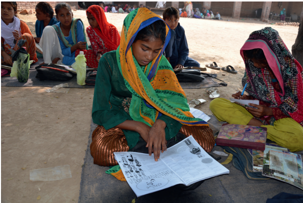
Waan garanayaa inay waxbarashadu tahay dariiqa kaliya ee lagu gaadhi karo nolol wanaagsan.