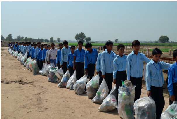
"Waxaanu haddaba sameynay No Litter Day gayagii ugu horeysay."

"Walaashay iyo hooyaday waxay kacaan afarta subaxnimo aroor kasta si ay ilaa fiidka xili danbe u sameeyaan labenka. Hooyo ayaa lacag badan ka deynsatey mulkiilaha warshada labenka si ay ugu daaweyso aabahey. Markaa laga bilaabo waxaanu noqonay adoomo uu mulkiilahu leeyahay.