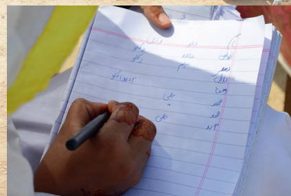
"Waxaan miisaamey dhamaan qashinka aanu soo ururinay iyadoo aanu markasta qornay miisaanka."