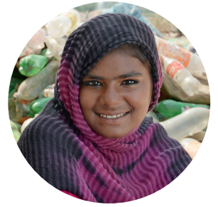
Sidra, 12 Fasalka 3, dugsiga-BRIC