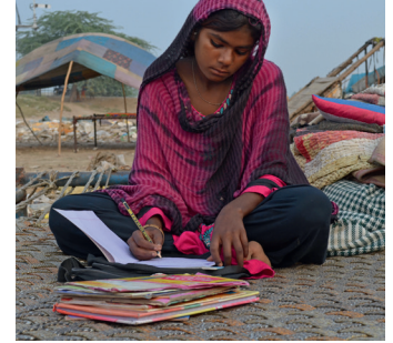
"Waxay aheyd mucjiso in dugsiga la bilaabo."

"Waxaanu ku dhalanay taandhadan iyadoo aanu safarka noloshayada ku dhameysan doono taandhadan. Dhamaan qoyskeygu waxay soo wada ururiyaan qashinka iyo xashiishka todoba maalmood ee isbuuca. Waxaanu kaas ka iibinaa qofka iibsanaaya iyadoo aanu lacagta cunto ku iibsano.