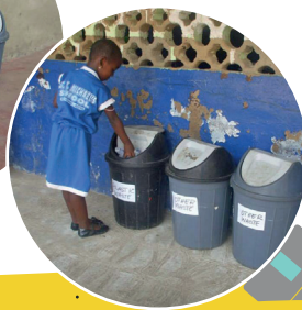
Qashin kala soocista laga sameynaayo St Michael Michael ku yaala Accra, kaas oo ka mid ah Dugsiyada Eco-Ghana.