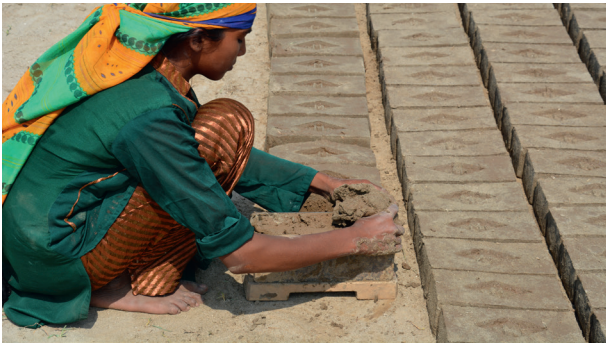
Waxaan maalin walba sameeyaa laba boqol oo laben ah.

Labada hablood ee baakistaan joogaa ayaa iyadoo la soo maraayo barnaamijka World's Children's Prize bartey xuquuqda carruurta. Hadda waxay doonayaan inay ka mid noqdaan No Litter Generation ( Jiil qashin la'aan ah) iyo No Litter Day (Maalin qashin la'aan ah) 16 maayo iyagoo qashin soo ururiya!