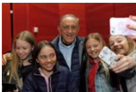
Barnrättshjältar möter elever i Sverige

I samband med den årliga WCP-ceremonin på Gripsholms slott får skolor i Sverige besök av jurybarn, barnrättshjältar och barn de kämpar för, samt unga musiker. Ni kan anmäla intresse för att ta emot en WCP-delegation. Även barn och lärare från grannskolor kan bjudas in när besökarna kommer.