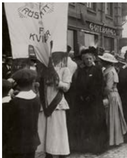
Demonstration för införandet av rösträtt för kvinnor i början av 1900-talet.

Ge bra och dåliga exempel från vuxenvärldens val, och berätta att dessa kan påverkas av korrupcion och maktmissbruk. Vissa kandidater, som har pengar och makt, kan t.ex. sprida falska nyheter i sociala medier, eller tvinga valarbetare att fuska.