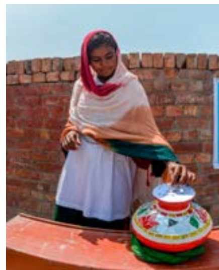
En flicka i Pakistan lägger sin röst i World's Children's Prize världsomröstning.