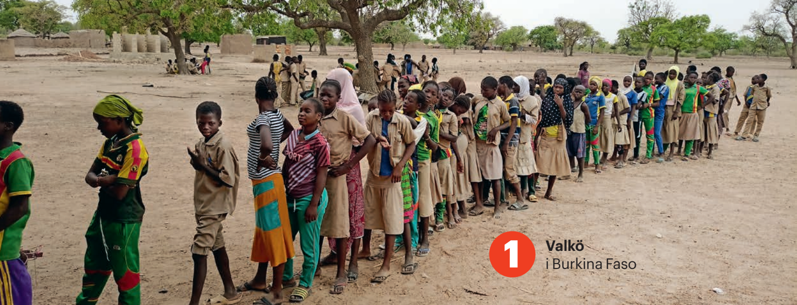
1 Valkö i Burkina Faso