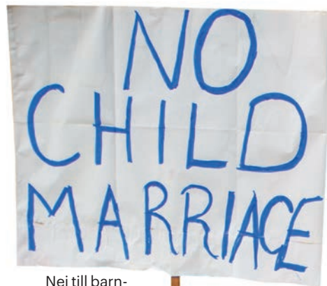
Nej till barnäktenskap.

Vilken väg ska ni ta för era 3 kilometer med plakat och banderoller? Kanske till stadens viktigaste byggnad så att så många som möjligt ser er? I många länder säkrar polisen vägen för barnens Jordan Runt-vandring.