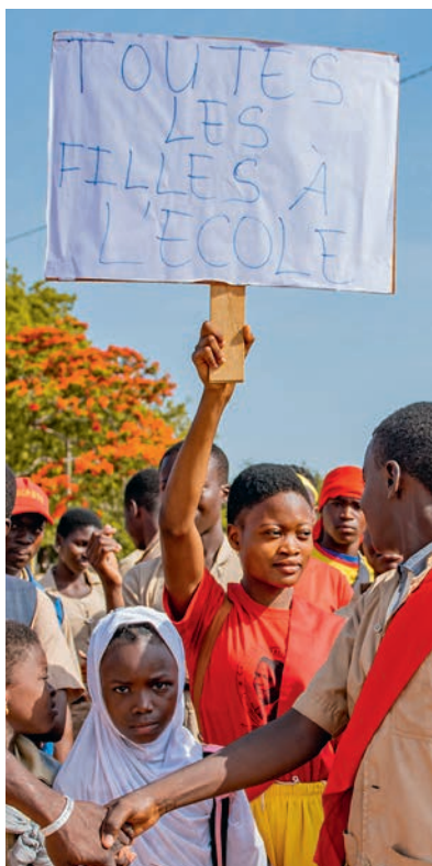
”Alla flickor i skolan.”

Till trummor, trumpeter och sång vandrar och dansar eleverna i Hubert Maga-skolan i Parakou i Benin sina tre kilometer, med sina skyltar där de ställer krav på respekt av olika barnets rättigheter, inte minst flickors lika rättigheter.