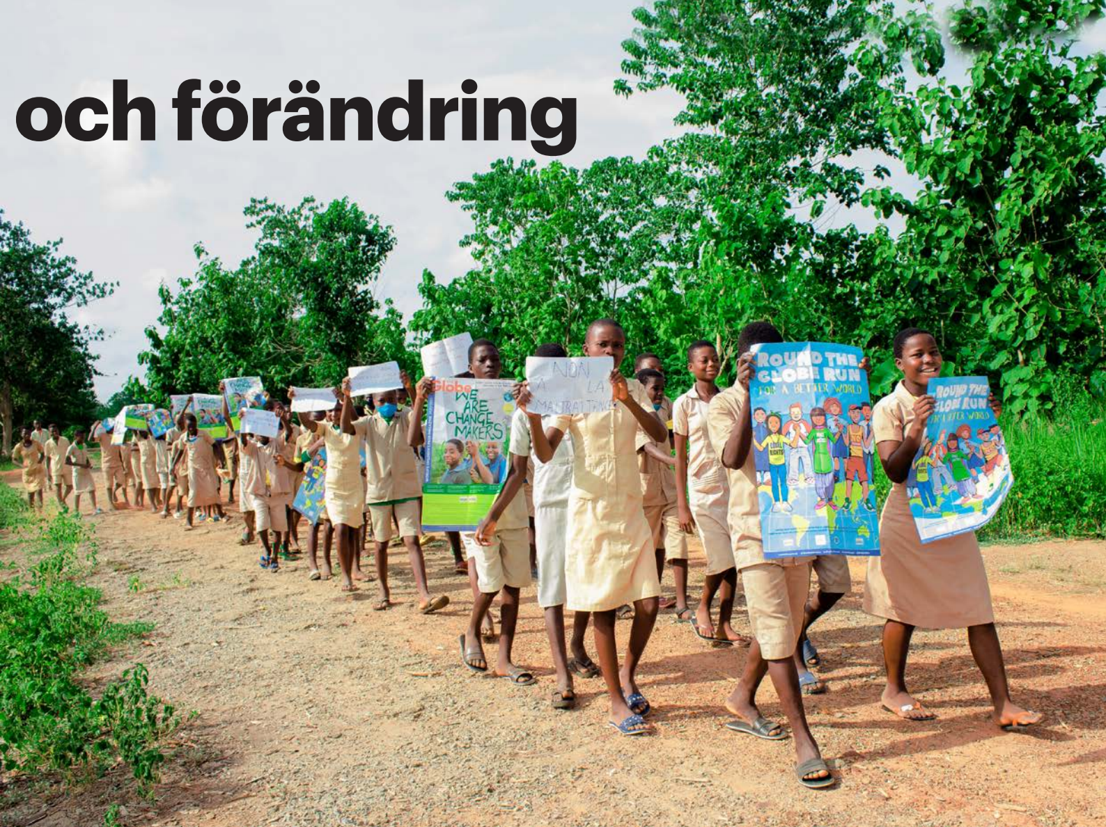
Eleverna i Massi-Zogbodomé-skolan i Benin vandrar sina tre kilometer med affischer och skyltar där de kräver ökad respekt för barnets rättigheter.