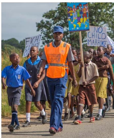
När eleverna i Hurungwe-skolan i Zimbabwe genomför sin Jordan Runtvandring går de på landsvägen. De har därförbett polisen om hjälp och han stoppar alla bilar och tvingar dem att köra sakta förbi.