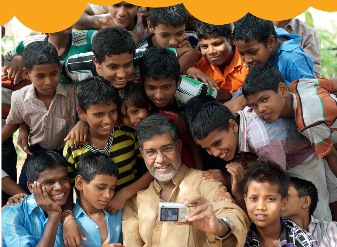
Kailash tar en selfie på Bal Ashram i Rajasthan, där hans organisation tar hand om befriade slavbarn.

Som ung började Kailash med risk för sitt eget liv befria barn som hölls som slavar på tegelbruk och i fabriker. Han startade Bachpan Bachao Andolan (BBA, Rädda barndomen) och byggde upp hem för befriade slavbarn. Då, för över 30 år sedan, talade nästan ingen annan i Indien om dessa barns rättigheter. Kailash dödsdotades och misshandlades och två av hans medarbetare mördades, men han gav inte upp. Idag har Kailash och BBA befriat över 80 000 barn. Hans kampanj mot barnarbete, Global Marsch Against Child Labour, är en rörelse som engagerar miljoner människor. Kailash arbete har bidragit till nya lagar och regler som skyddar barns rättigheter i hela världen. Hans märkning av barnarbetsfria mattor, GoodWeave, har minskat antalet barn i mattindustrin från en miljon till 250 000, och tusentals fattiga byar har fått hans hjälp att bli "barnvänliga". WCP-barnjuryn valde i februari 2014 Kailash till kandidat till World's Children's Prize 2015. I november 2014 tillkännagavs att han fått Nobels fredspris tillsammans med Malala Yousafzai.