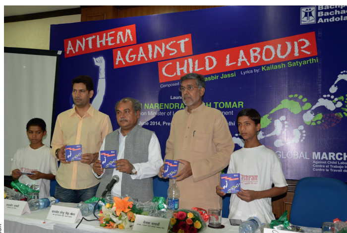
En indisk minister (t.v. om Kailash) skänkte en månadslön till kampen mot barnarbete.

Efter flera marscher genom Indien fick Kailash hela världen att vandra tillsammans med honom. Slutmålet var Genève i Schweiz, där den internationella arbetarorganisationen ILO har sitt högkvarter. I Global March against Child Labour marscherade hundratusentals barn, föräldrar och aktivister i 103 länder sammanlagt 8 000 mil i sina hemländer. Kailash och en grupp befriade slavbarn kom fram till Genève samtidigt som en stor ILO-konferens startade. De bjöds in att tala och för första gången lyssna-