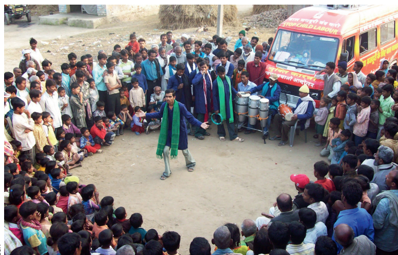
Barn från Kailashs organisation spelar teater om människohandel.

När Kailash började resa runt i Indien fick han en chock. Situationen för barn var ännu värre än han hade trott. Barn köptes och såldes som handelsvaror och hölls som slavar på fabriker och i stenbrott, ofta hundratals mil från sina familjer. En del hade sålts av sina egna föräldrar. Andra lurades att de skulle få gå i skolan, eller kidnappades. En liten slavflicka frågade Kailash: