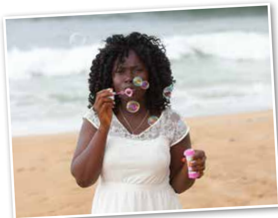
Finkläd och med fin naglar.