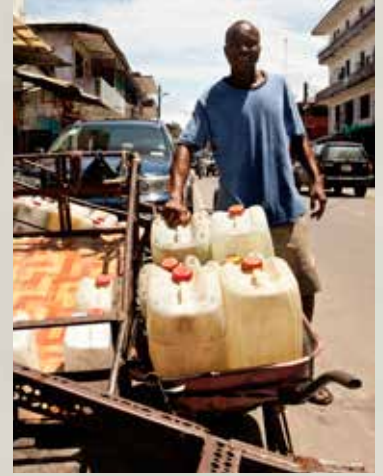
Vatten till tvätt och att dricka.