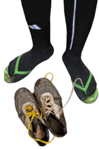
Fredrick värmer upp med flip-flop-sandaler, men får låna ett par skor från spelaren han byter av med under matchen.