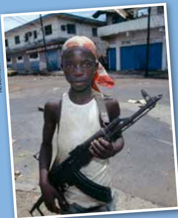
Barnsoldat under kriget i Liberia.