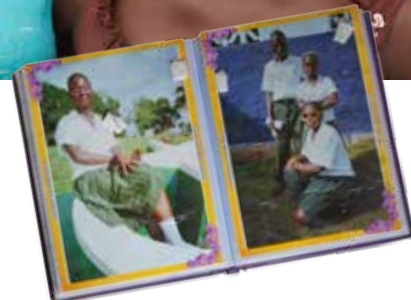
Nene i sitt fotoalbum, som är en av hennes käraste ägodelar.

te slå barnen, vad ska det annars bli av dom?