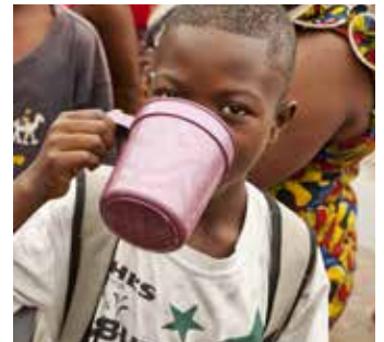
En klunk av det filtrerade vattnet ...