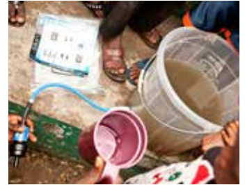
Filtret gör det smutsiga vattnet drickbart.