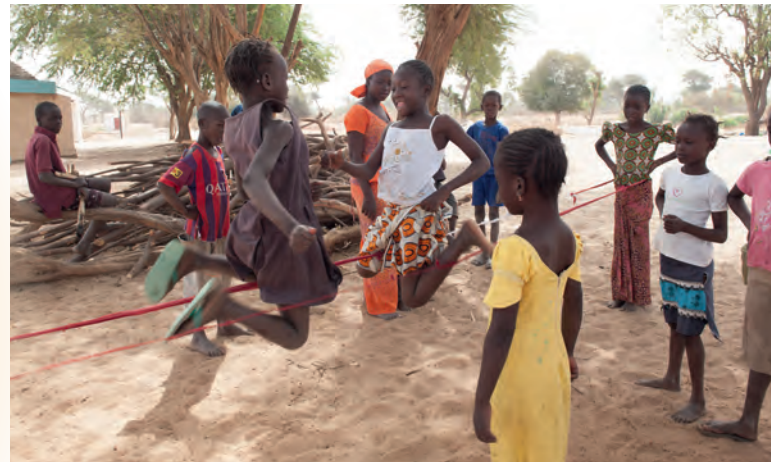
Solenergilamporna har förvandlat byn på kvällarna. Nu är det inte längre kolmörkt.

Nu när hon kan göra läxorna på kvällen i solenergilampans sken, blir det mycket mer tid för lek med kompisarna på eftermiddagarna.