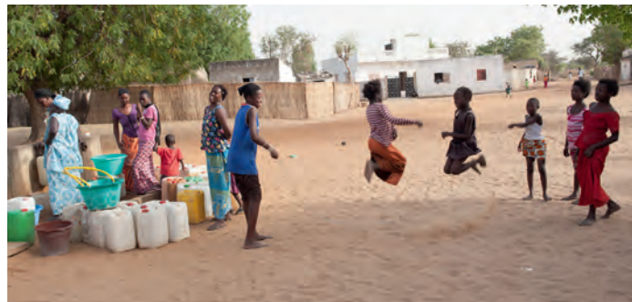
Alla barn har uppgifter att hjälpa till med, som att hämta vatten, men det är också viktigt att barnen hinner leka.

Men när hon anlände till huvudstaden Dakar kände hon: ”Det här är min plats på jorden.”