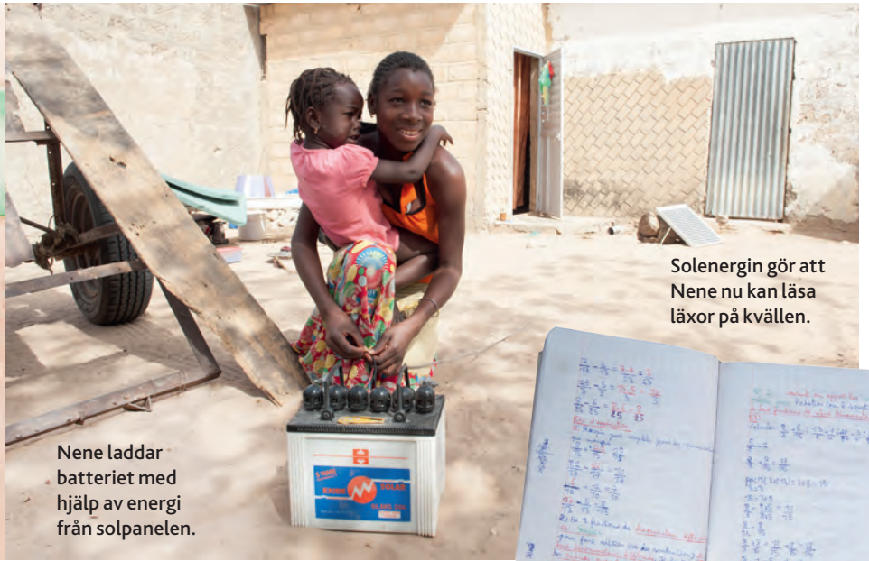
Nene laddar batteriet med hjälp av energi från solpanelen.