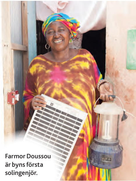
Farmor Doussou är byns första solingenjör.