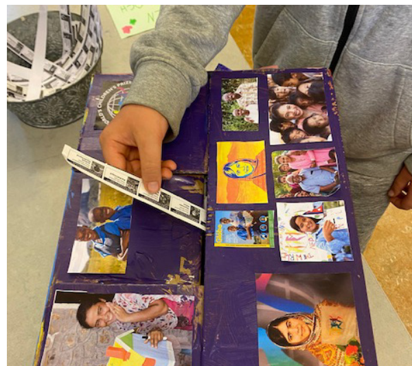
Elev från Ålstenskolan i Bromma lägger sin röst i skolans valurna.