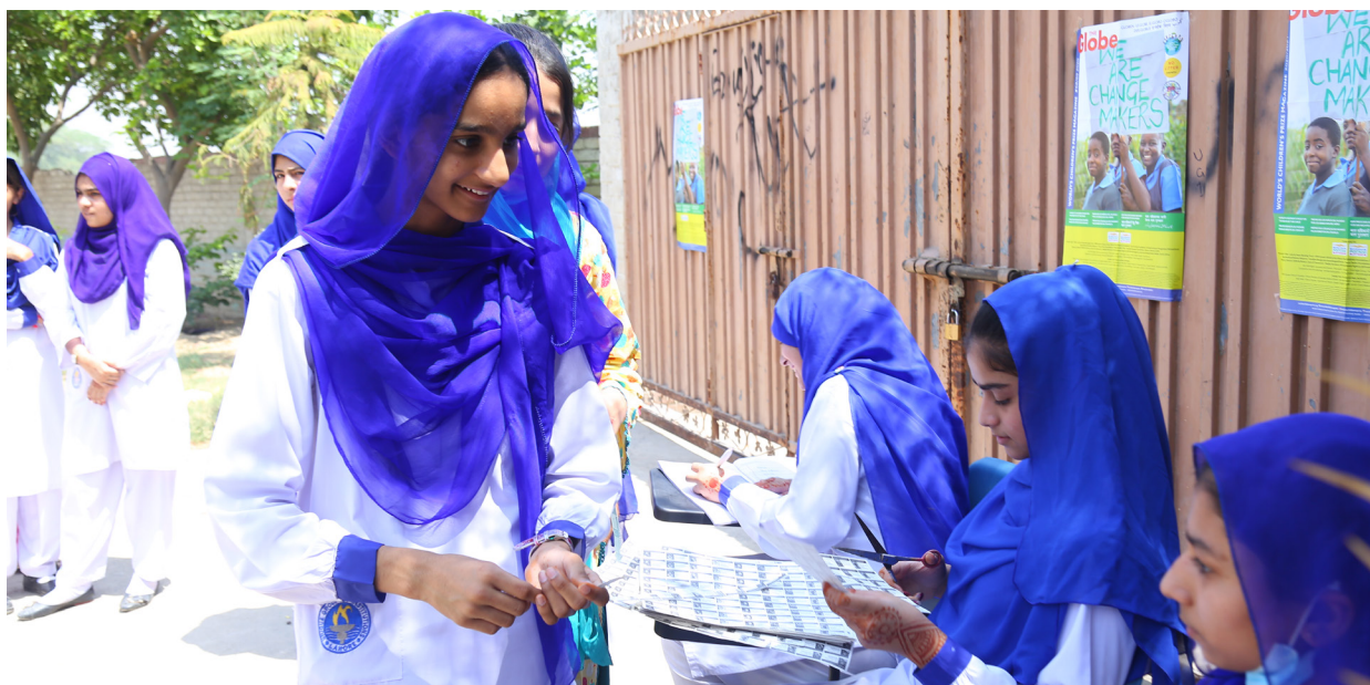
Elever i Pakistan får sina valsedlar för att lägga sin röst på i barnens demokratiska världsomröstning Global Vote.

World's Children's Prize-programmet har genomförts sedan år 2000. Erfarenhet, utvärdering och löpande utveckling av programmet har under åren vuxit till en gedigen resursbank av kunskap och metodkunskande för kvalitativt och effektivt genomförande. Kanslipersonal och kontraktbaserad expertis har tillsammans en bred erfarenhetsprofil och kompetens inom relevanta områden. Verksamheten bygger på effektiv samordning och tillvaratagande av komparativa fördelar.