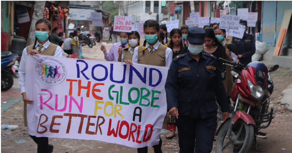
Elever i Nepal deltog i Jordan Runt-loppet för en bättre värld där de manifesterade för vilka förändringar de vill se för barn och för ett bättre lokalsamhälle, land och värld.