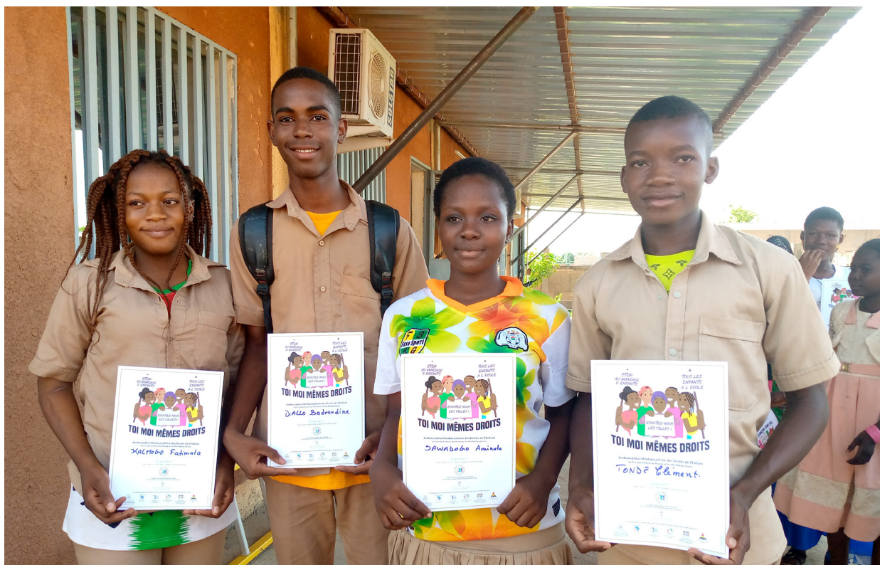
Elever i Burkina Faso som deltar i en kurs där de utbildas till barnrättsambassadörer som står upp för flickors lika rättigheter.

WCPF har valt att adressera problemen utifrån ett "underifrånperspektiv". Vi är övertygade om att en långsiktig och hållbar förändring i grunden även måste byggas underifrån. Viljan och kraven på förändring måste växa fram hos individen och gruppen lokalt, för att sedan utgöra en kritisk massa i samhället och bidra till ett dynamiskt civilsamhälle.