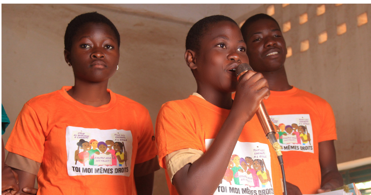
Elever i Benin, som deltar i projektet Toi Moi Mêmes Droits (Du Jag Lika Rättigheter), och utbildas till barnrättsambassadörer.

Kvalitativt nås sekundära målgrupper bäst genom att deltagande barn som förändrare informerar och påverkar sina vänner, syskon, föräldrar och övrig släkt, grannar samt övriga i lokalsamhället. WCPF arbetar även för att nå ut till allmänhet och bredare målgrupper kring frågor om barnets rättigheter via såväl print som i digitala medier. WCPF arbetar strategiskt för att öka kunskaperna även hos dessa sekundära målgrupper genom en genomtänkt medie- och kommunikationsstrategi och