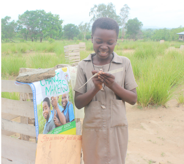
Elev i Benin lägger sin röst i valurnan under världsomröstningen Global Vote.

WCP-programmet bygger på en mål- och resultatstyrning, där hela verksamhetscykeln syftar till att säkra så goda resultat som möjligt på såväl kort-, medellång- som längre sikt. WCP-programmets resultat och effekter mäts på olika nivåer. På projektnivå identifieras kon-