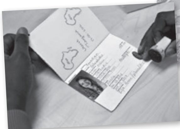
Tillverka egna pass och andra resedokument.