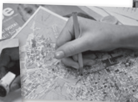
Hitta rätt i en ny stad.