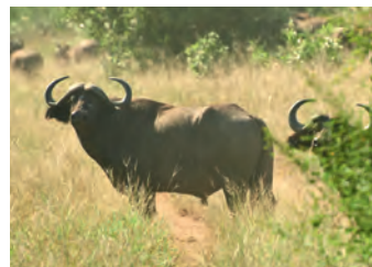
Buffelköttet betalade Blessings skolavgifter.

När jag gick i skolan kom Chiljokklubben och undervisade oss. Vi lärde oss om naturen, kretsloppet och om vilda djur och varför dom behöver bli beskyddade. Dom berättade också hur viktigt det är att